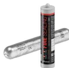
FIRE SEALING page 130 -132