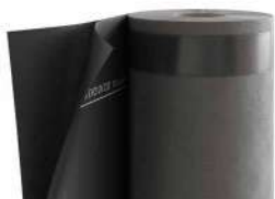
TRASPIR EVO UV 210 page 272